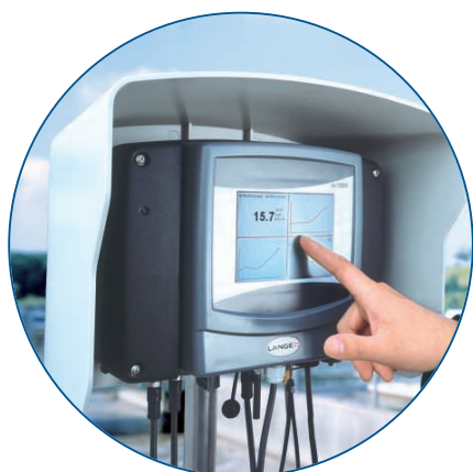
Ilustracja 2: Prosta obsługa przetworników SC 1000 za pomocą ekranu dotykowego