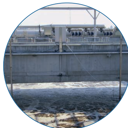
Ilustracja 6: W zbiornikach z osadem czynnym pomiar jest dokonywany w kilku miejscach.