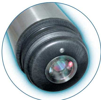
Ilustracja 1: Czujnik LDO ze zdjętą nasadką