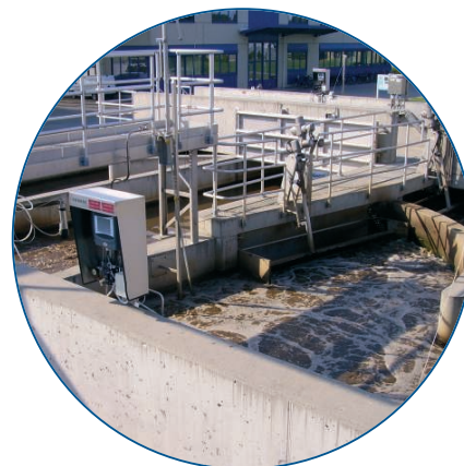
Ilustracja 5: Instalacja przetworników SC 1000 na krawędzi zbiornika

Opisane tutaj właściwości przyczynią się do tego, że optyczna metoda pomiaru będzie zyskiwała na znaczeniu, stopniowo wypierając elektrochemiczne metody pomiarów.