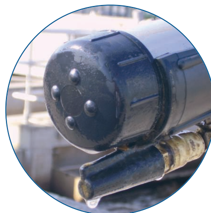
Ilustracja 7: Powierzchnia czujnika nie wykazuje oznak zanieczyszczenia, nie ma konieczności czyszczenia sprężonym powietrzem.